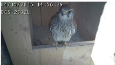
Erster Augenschein vom Nistkasten

Im Schloss Klingnau ist seit langem eine Kolonie Dohlen beheimatet. Um die Osterzeit herum interessiert sich auch ein Turmfalkenpaar für einen Nistplatz im Schlossturm. Im Turm und dem Schlossanbau gegen das Städtli sind 6 Nistkasten für Dohlen installiert. Im obersten Turmfenster gegen den Stausee gerichtet, ist ein Nistkasten für Turmfalken eingebaut. Die Nistkasten werden vom Schlosswart und Mitgliedern des Naturschutzvereins betreut. Seit Ostern 2015 sind drei Webcams installiert, welche einen Einblick in ein Dohlennest und den Turmfalkenhorst bieten. Die Dohlen-Kamera zeigt den Einblick in ein gegen Koblenz gerichteten Nestes.